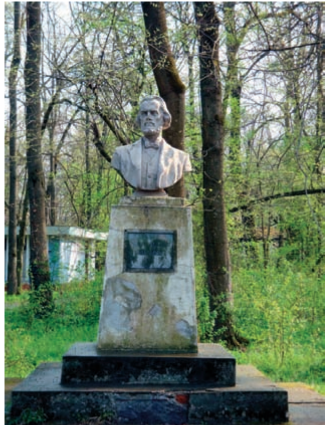
Bustul lui Nicolae Bălcescu - Palermo, Sicilia

Ideologia comunistă românească, sprijinindu-se pe unele lucrări ale lui Karl Marx, îl considera pe Nicolae Bălcescu drept un înaintaș al acesteia. Poate că acesta este motivul pentru care după 1989 per-