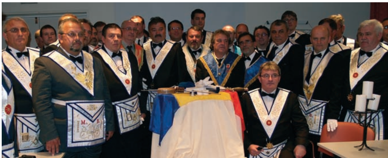
Membrii Marelui Consiliu alături de delegațiile invitate la Conventul Anual din 25 aprilie 6009

Au fost primite felicitari adresate Marii Loji Nationale a Romaniei, cu ocazia Sfantelor Sarbatori de Iarna