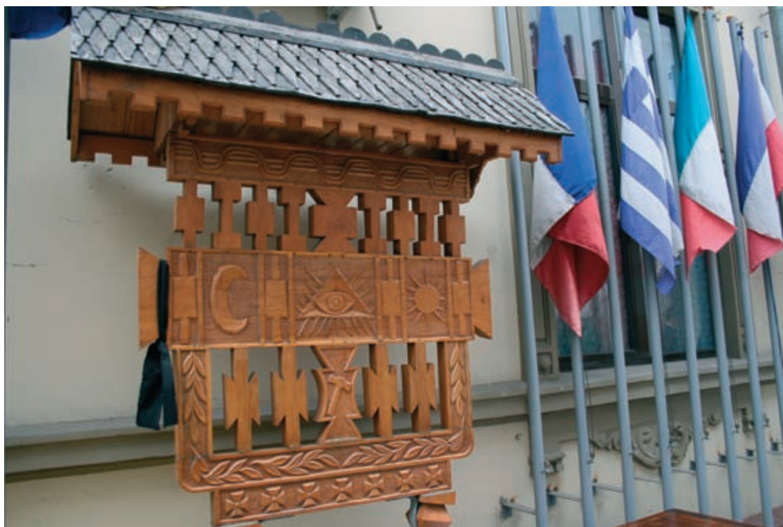
Troiță masonică realizată prin bună-voința membrilor lojii țărănești din celebrul sat Hobița (locul de naștere al sculptorului Constantin Brâncuși)

lașitatea, ateismul, necinstea, falsificarea istoriei, totalitarismul și extremismul de orice fel.